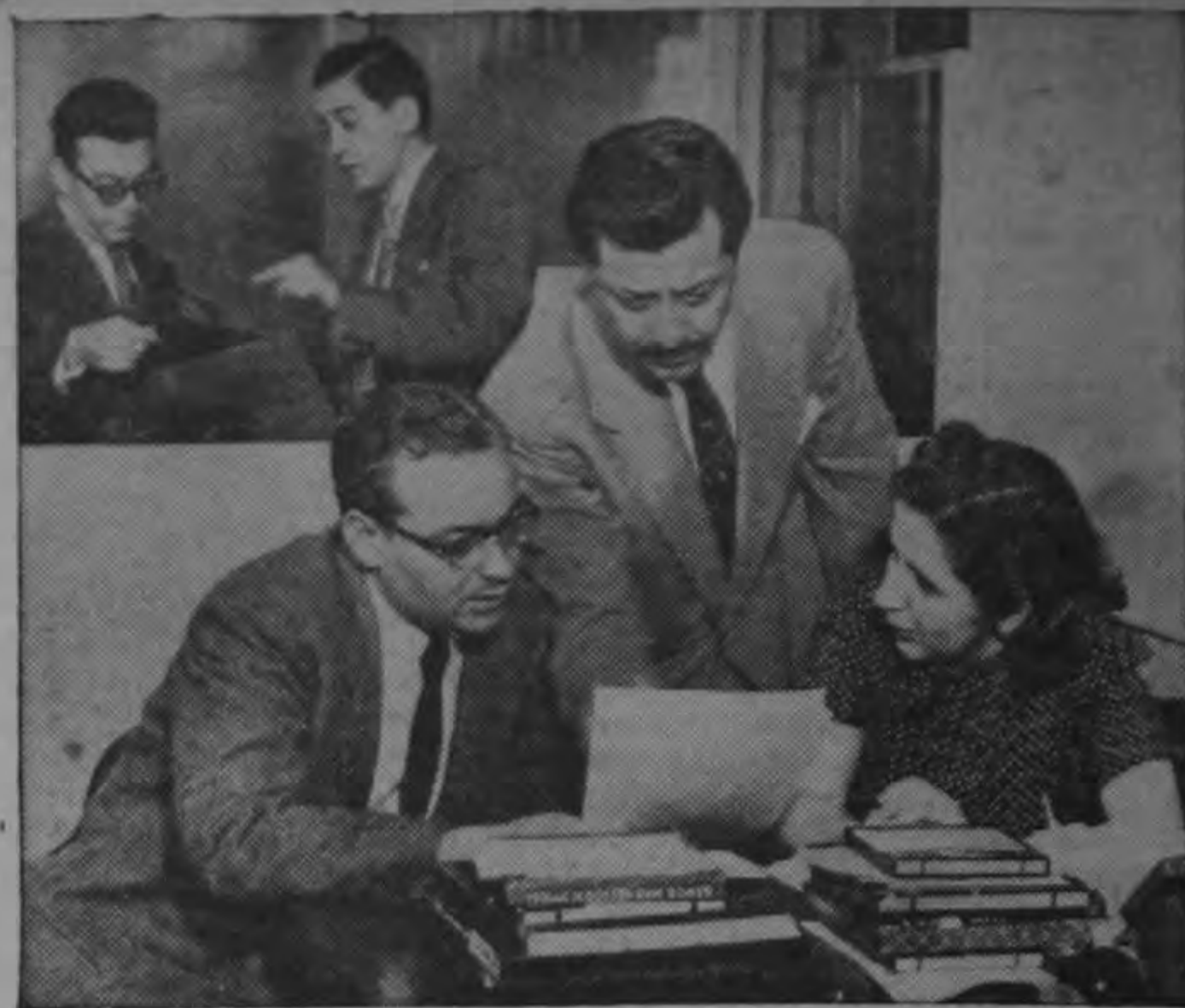
Directores de las secciones en español de "La Voz de los Estados Unidos de América" discuten planes sobre el programa nocturno continuo que el día de las elecciones presidenciales será ofrecido en español durante toda la noche.

Los aumentos sobre las partidas de presupuesto del corriente año, se localizan principalmente en el impuesto sobre la renta, territorial y derechos de aduana, mientras que el producto de menos más importante se registra en el Impuesto al café que reciben los Beneficiarios, diferencia que ascendió a C 2.4 millones.