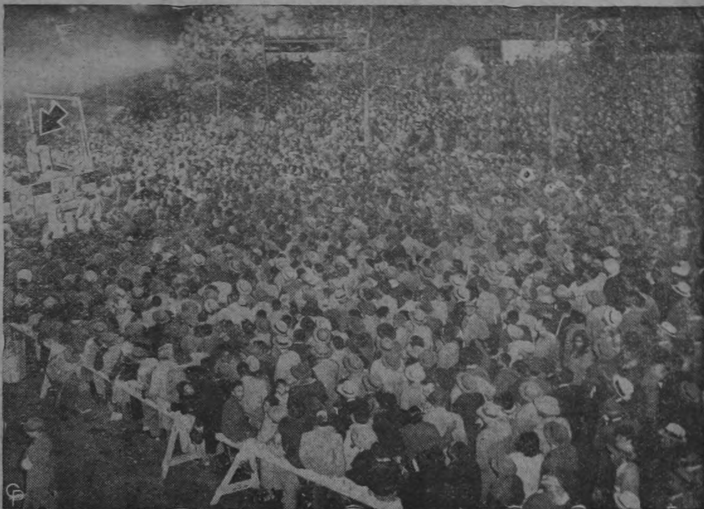
La flecha señala a Adlai Stevenson, candidato del Partido Demócrata a la Presidencia de los Estados Unidos, cuando se dirige a una multitud de más de 75.000 personas desde una tribuna levantada en el barrio popular de Harlem. Stevenson manifestó que sus ideas no cambiaban según las variaciones de su itinerario, y que allí, en Harlem, iba a sostener los mismos puntos de vista que había expresado en Richmond, Virginia, sobre los derechos políticos, o en Texas, acerca de la cuestión petrolera.